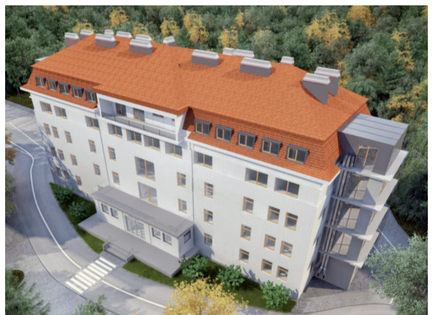
Možná podoba domova pro seniory v Houštkce