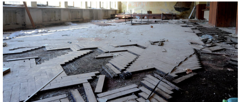
Současný stav bývalé koleje Kim Ir Sena, Houštka