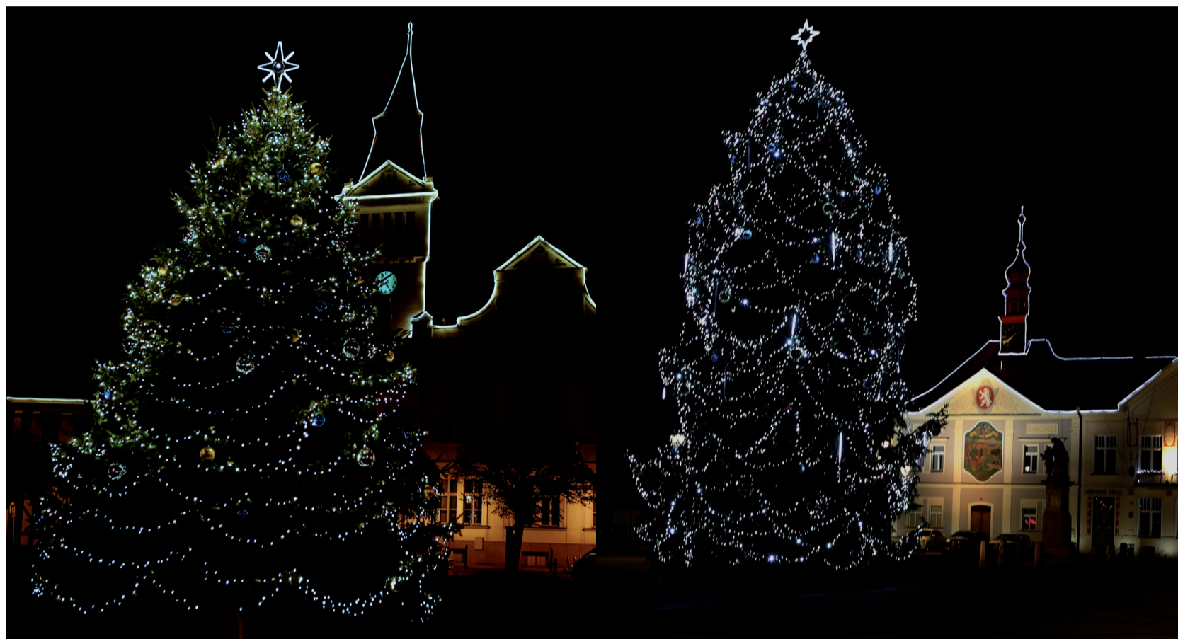
Vánoční stromky v Brandýse i ve Staré Boleslavi se letos opravdu povedly

zima 2019 | facebook.com/stanbrandysboleslav | Brandýs nad Labem-Stará Boleslav | Neprodejně