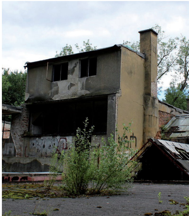
Současný stav budovy Slunečních lázní, Houštka