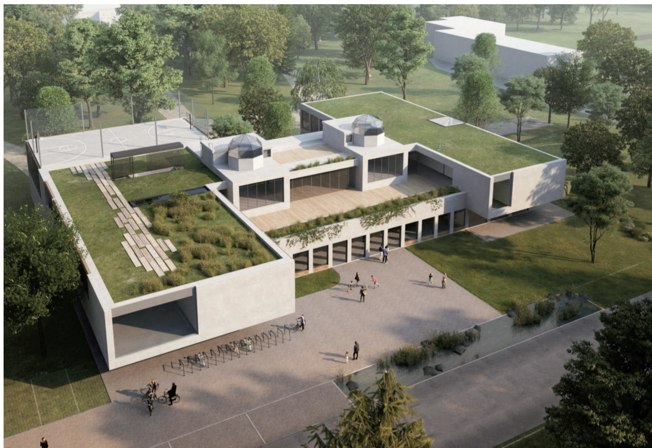
Možná podoba základní školy v Houštce

nost případného škrtnání ostatních prioritních projektů. Pravidelný zajištěný příjem ve výši 5 milionů Kč při nutné investici v řádu cca 100 milionů Kč ovšem staví celý problém do naprosto jiného světla a dělá tuto investici, v případě politické shody nad dlouhodobým řešením této lokality, pro město naopak ekonomicky velmi smysluplnou. Návratnost investice při takto zajištěném příjmu se bude pohybovat na úrovni maximálně 30 let a při běžné životnosti budovy vygeneruje za dalších 20 let kumulovaný příjem 100 milionů Kč, které je možné využít na další investiční projekty, třeba