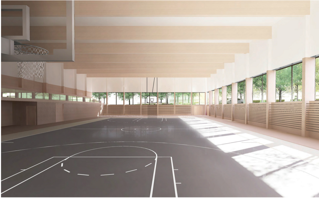
Vizualizace sportovní haly ZŠ Palachova (Autor: Ing. arch. Klára Houštická)