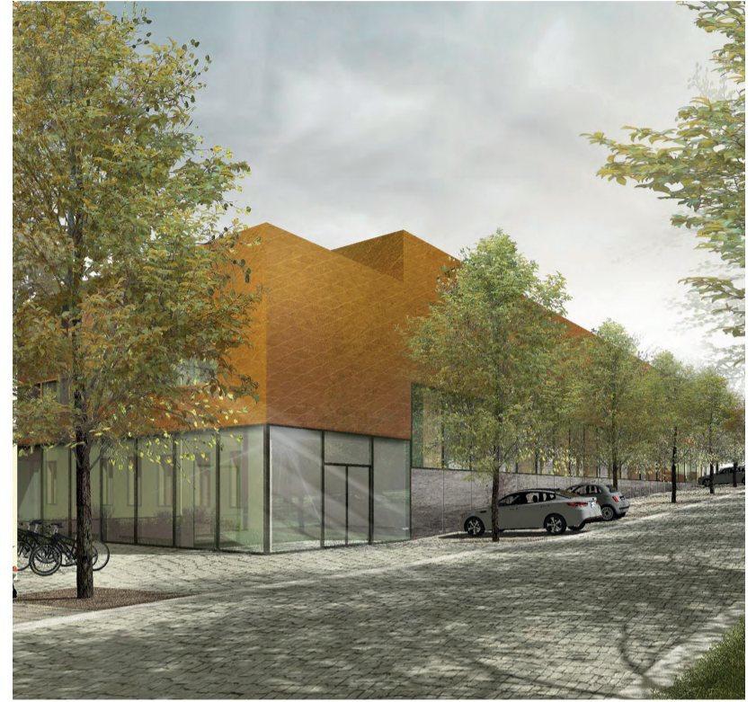
Vizualizace sportovní haly ZŠ Palachova (Autor: Ing. arch. Klára Houštická)

Městské listy, nad kterými drží „monopol“ Naše Dvojměstí, o této, ještě před komunálními volbami v roce 2018 „zásadní sportovní stavbě města“, povětšinou mlčí. Netušíme, jestli je to výsledek jejich neúspěšné snahy z loňského roku prosadit výrazné okleštění původního projektu, ale pro nás se i nadále jedná o klíčovou stavbu, která má vyřešit hned několik velmi aktuálních problémů města v rámci jednoho jediného projektu. A za poslední půl rok se toho znovu událo opravdu hodně, o čem je možné psát. Jsme po mnoha peripetiích v poslední fázi projektových příprav a k samotné realizaci tak chybí poslední krok.