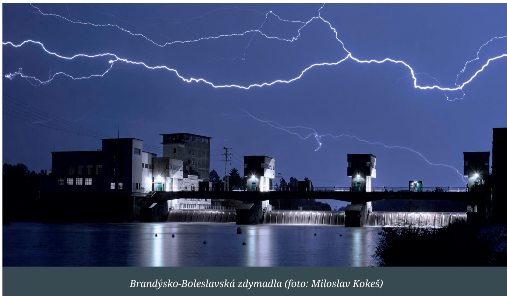
Brandýsko-Boleslavská zdymadla

léto 2021 | facebook.com/stanbrandysboleslav | Brandýs nad Labem-Stará Boleslav | Neprodejné