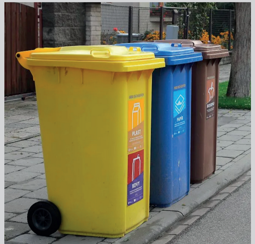
Stejná velikost nádob na tříděný odpad pomůže i nám

Zarážející na celé situaci je fakt, že město bezesporu disponuje daty o objemu tříděného odpadu z minulých let. A to nejen celkového, ale velmi pravděpodobně i z jednotlivých svozových tras. Pokud by tedy celý systém nastavila na základě těchto dat, s přihlédnutím k aktuální pandemické situaci a jejímu vlivu na odpadové hospodářství, mohl být výsledek celé akce úplně jiný. A vydělali bychom na tom úplně všichni.