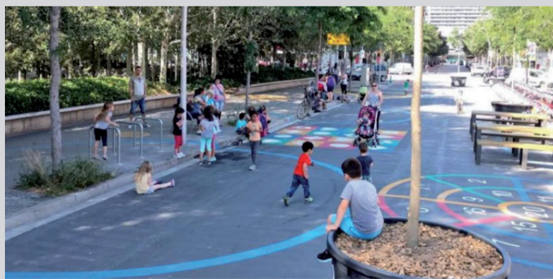
Příklad zklidnění dopravy v centru Barcelony.