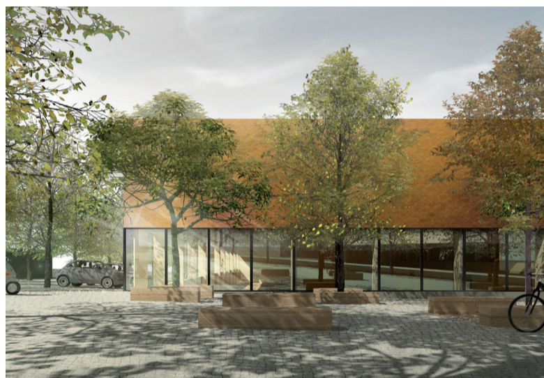
Vizualizace sportovní haly u ZŠ Palachova.