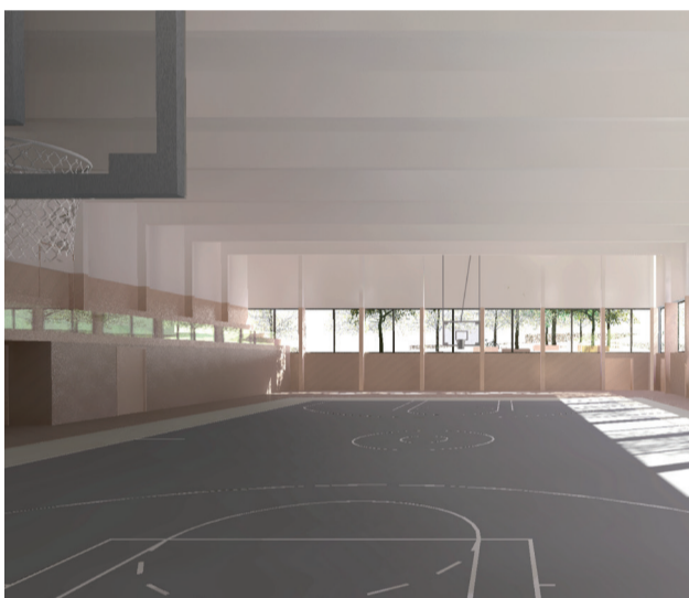
Vizualizace sportovní haly u ZŠ Palachova.