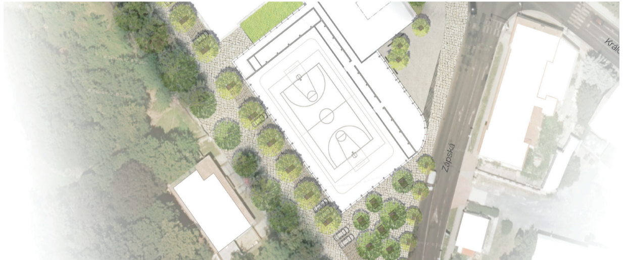
Vizualizace sportovní haly u ZŠ Palachova.