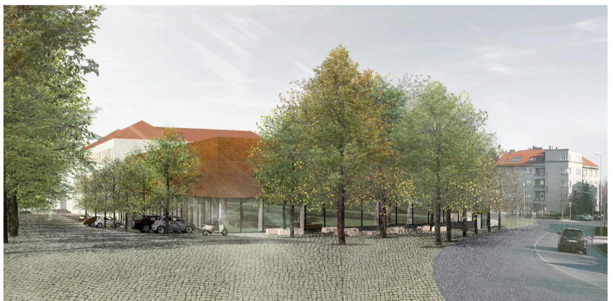
Vizualizace sportovní haly u ZŠ Palachova.