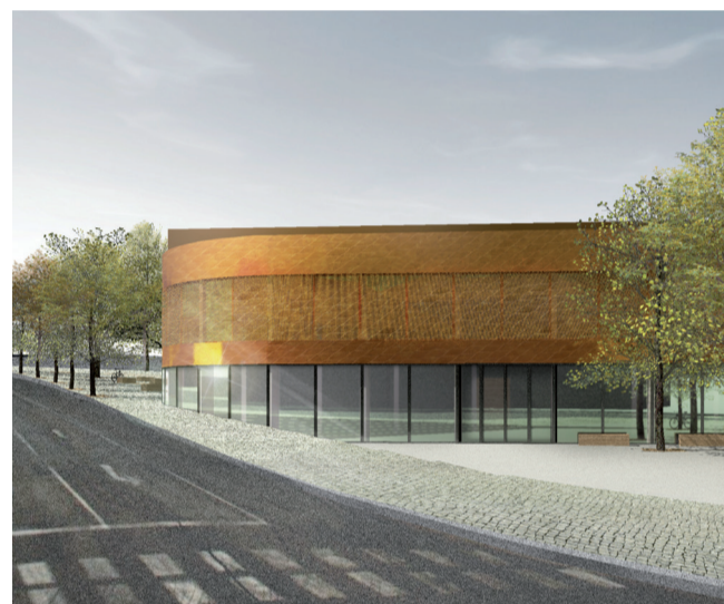
Vizualizace sportovní haly u ZŠ Palachova.