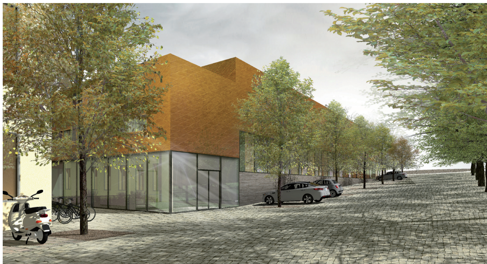
Vizualizace sportovní haly u ZŠ Palachova.